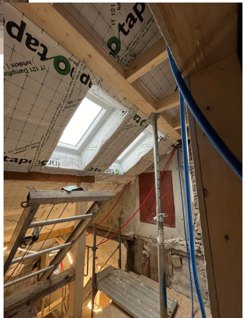
Ausbau ehemaliger Estrichräume mit neuen Dachfenstern