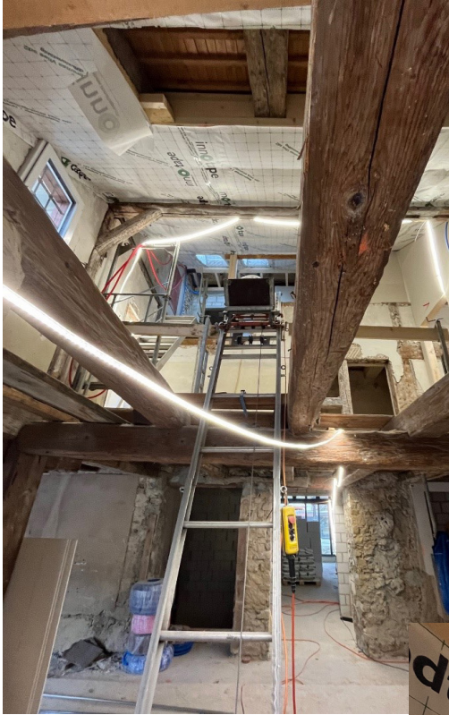
Der Hohlraum über dem Pfarrsaal wird sichtbar und ausgebaut